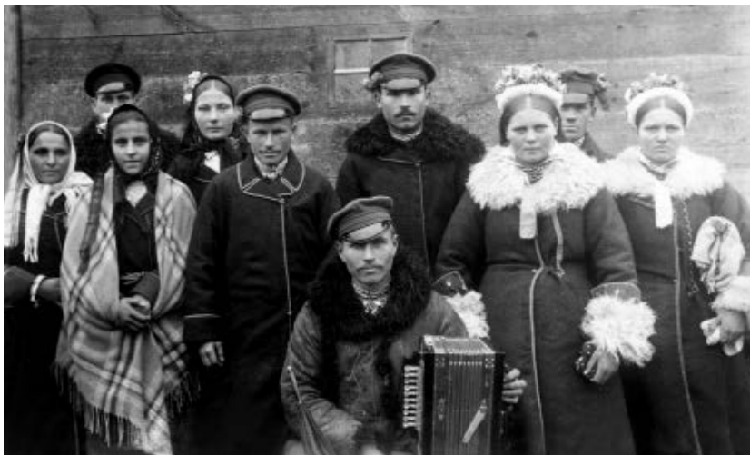
Сяляне в. Воўчын Гродзенскай губ. у вясельных строях. Пачатак XX ст.

цёле. Бралі шлюб звычайна ў нядзелю або ў рэлігійнае свята, каб вяселле на доўга запомнілася ўсім членам сям’і. Адзін з заснавальнікаў беларускай этнаграфіі П. В. Шэйн пісаў у 1902 г.: «Здаецца, нідзе больш сялянскае вяселле не суправаджаецца такімі цырымоніямі і абрадамі, як у Беларусі... Змяніць або прапусціць што-небудзь з вясельнага абраду лічыцца злачыствам. Калі ж нешта падобнае адбылося падчас вяселля, то гэта ўспрымаецца як нядобрае прадвесце для маладой пары. Адным словам, абрадавы бок вяселля ўзведзены ў догмат і раўнасільны, на іх думку, царкоўнаму шлюбу» 18 .