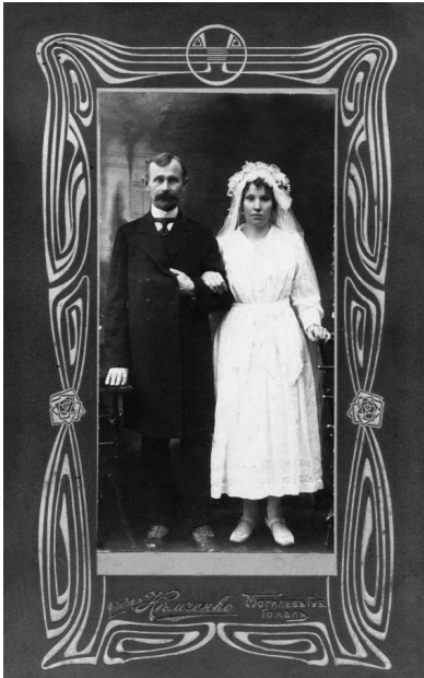
Жыхары Гомеля ў вясельных строях. Пачатак XX ст.

Дарэвалюцыйнаму беларускаму гораду, гэтаксама як і шляхецкай сядзібе, была ўласціва патрыярхальнасць сэксуальна-сямейных адносін. Культурнай нормай з'яўляліся інтымныя адносіны паміж мужчынам і жанчынай, а таксама нараджэнне дзяцей у межах шлюбу, звычай і сватаўства і вяселля, дамінантная роля мужчыны-бацькі. Разам з тым сацыяльна-эканамічная мадэрнізацыя, якая значна паскорылася пасля адмены прыгоннага права, адбілася на сямейна-шлюбных адносінах і сэксуальнай маралі перш за ўсё гараджан. Гэты працэс суправаджаўся дэарганізацыяй традыцыйнай сям'і — паслабленнем пачуцця сямейных абавязкаў, адчужэн-